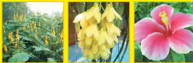
ชুমเห็ดเทศ