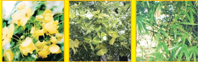
ทรงบาดาล