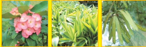
โป๊ยเซียน