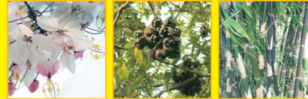
กัลปพฤกษ์