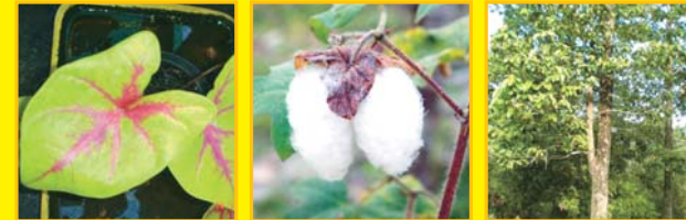
ปาริชาติ